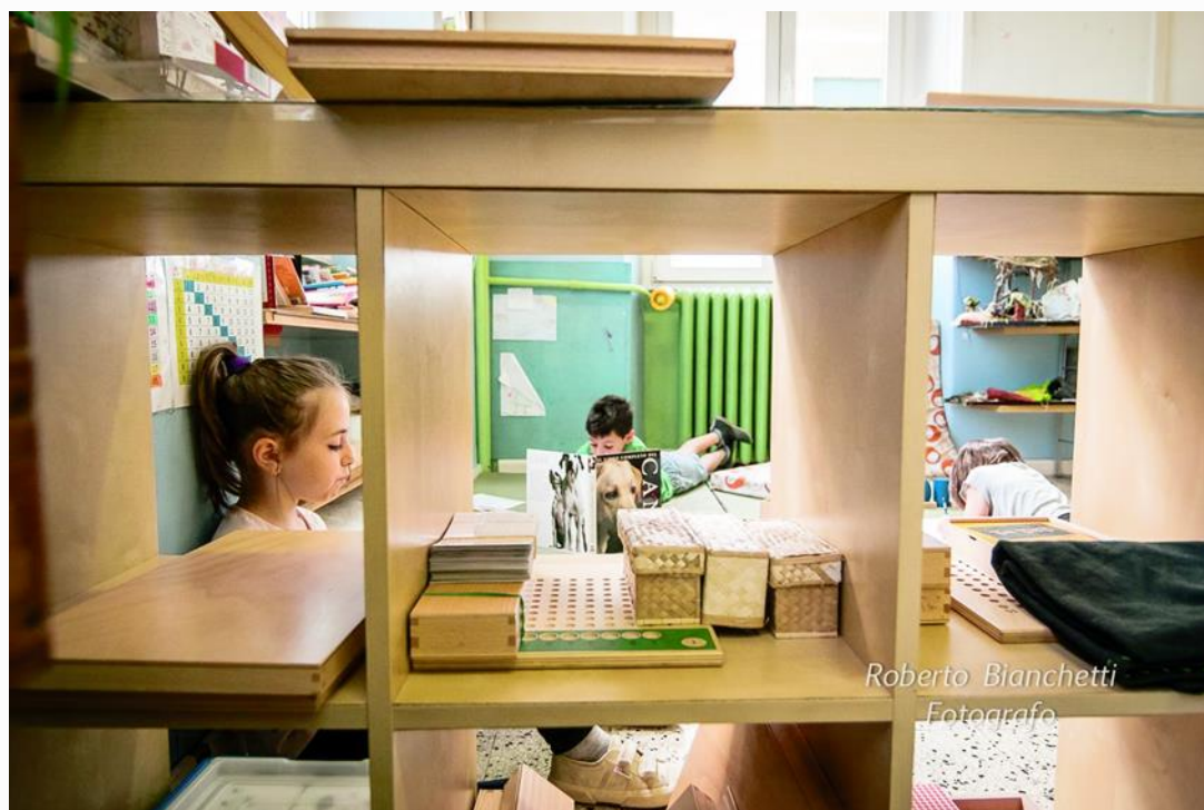
Roberto Bianchetti Fotografo

Insegnare a ricomporre i grandi oggetti della conoscenza - l'universo, il pianeta, la natura, la vita, l'umanità, la società, il corpo, la mente, la storia - in una prospettiva complessa, volta cioè a superare la frammentazione delle discipline e a integrarle in nuovi quadri d'insieme. (Indicazioni Nazionali)